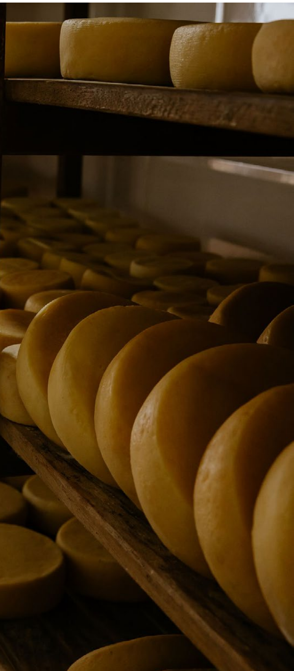
Queijo Canastra.