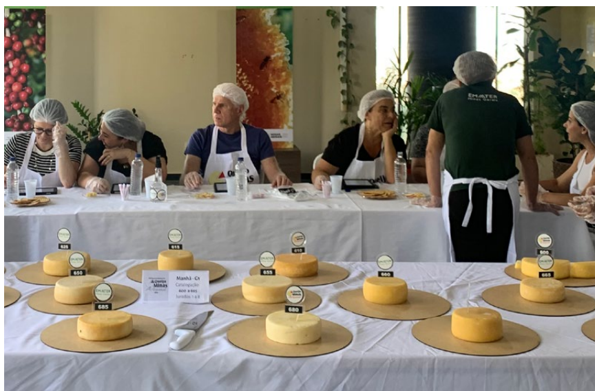
Concurso valoriza uma das iguarias mais tradicionais de Minas.

avaliados quesitos como aparência, textura, sabor e aroma — atributos que expressam o terroir e a tradição de cada localidade. Podem participar as dez regiões reconhecidas como produtoras de Queijo Minas Artesanal, além dos queijos das regiões de Alagoa e Mantiqueira de Minas, que concorrem em categorias específicas na competição.