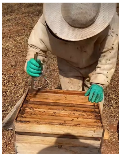
Empresa orienta apicultores em mais de 400 municípios.

O Certifica Minas Café, executado pela Emater-MG em parceria com o Instituto Mineiro de Agropecuária (IMA) e a Empresa de Pesquisa Agropecuária de Minas Gerais (Epamig), é o maior programa público de certificação de propriedades cafeeiras do país. A iniciativa promove a adoção de boas práticas agrícolas, ambientais e trabalhistas, reconhecidas internacionalmente.