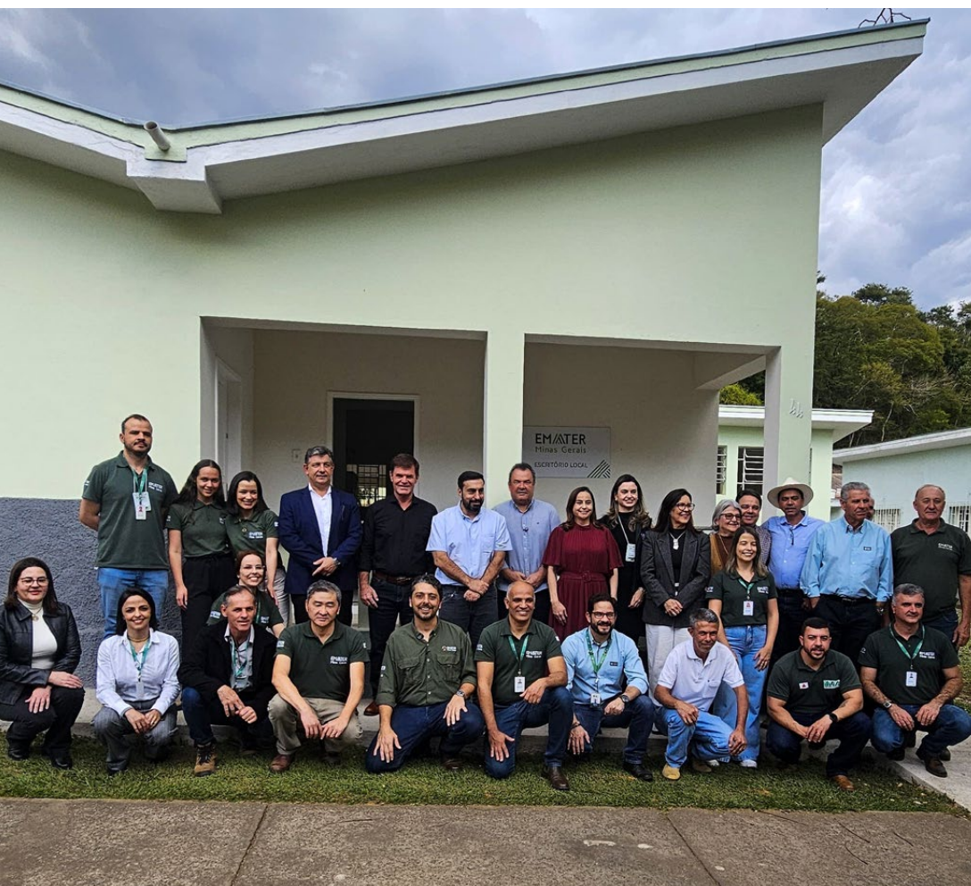
Escritório Local de Viçosa.