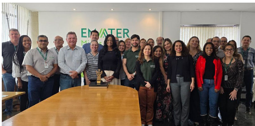
Emater-MG recebe Prêmio Follett de Gestão Humanizada em dezembro de 2025.

Há ainda a prospecção de editais de instituições de ensino, pesquisa e universidades, com oferta de cursos gratuitos para pós-graduação lato sensu e stricto sensu, além de curadoria de cursos virtuais de acesso livre, livros, filmes e podcasts, na proposta do Plano de Desenvolvimento Individual.