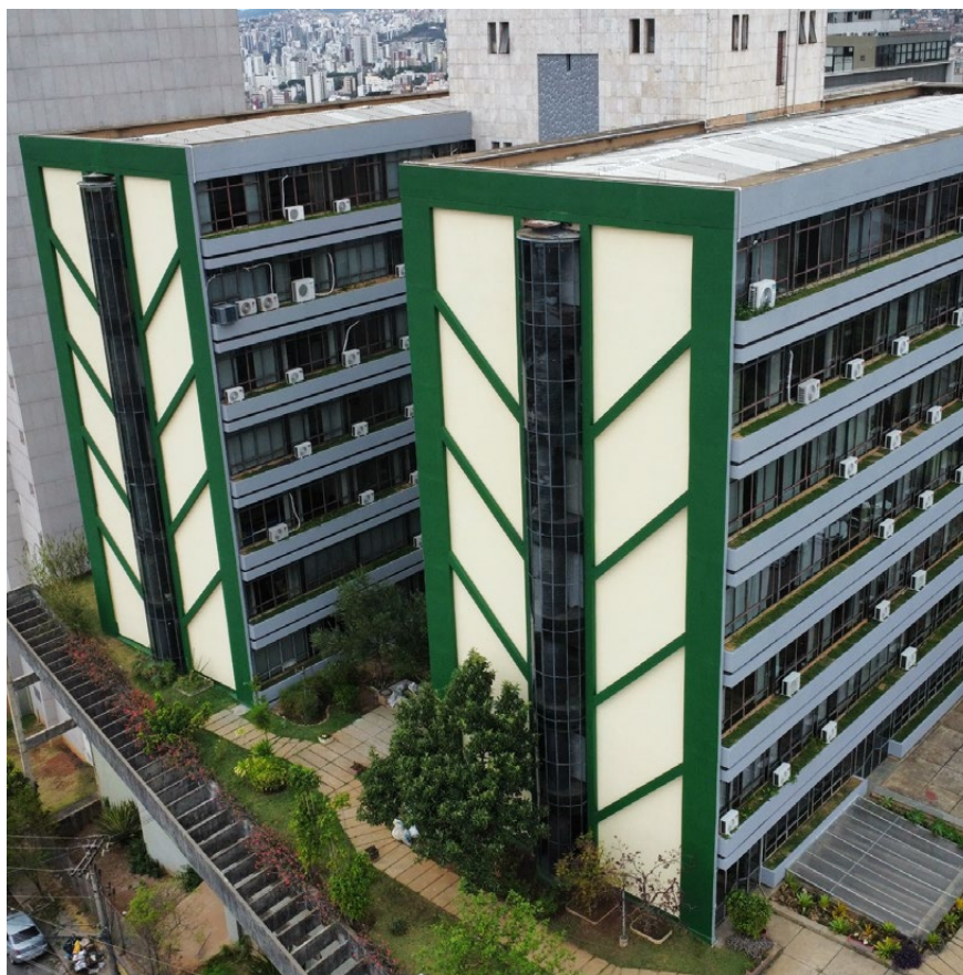
Unidade Central da Emater-MG após as reformas.

O atendimento de qualidade ao público e o bem-estar dos funcionários são prioridades para a Emater-MG. Nos últimos cinco anos, a empresa investiu na revitalização e modernização de sua sede, em Belo Horizonte, e de suas unidades locais, nas regiões do estado. Desde 2021, a instituição investiu cerca de R$ 10 milhões em obras e, nos últimos dois anos, destinou R$ 12,4 milhões para a aquisição e instalação de móveis e eletrônicos.