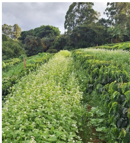
Plantio de café consorciado com plantas de cobertura.

Desde o início do programa, já são 139 edições, com a participação de quase 15 mil agricultores de 541 municípios. Um verdadeiro impulso para o desenvolvimento da fruticultura em Minas.